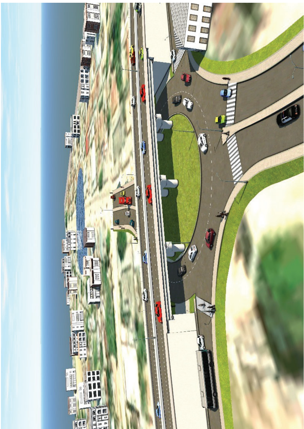
Muonekano wa Daraja la juu (Fly Over) katika eneo la Mwanakwereke baada kukamilika Ujenzi huo