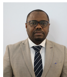
Dkt. Makame O. Makame Mkurugenzi Idara ya Uhifadhi wa Maeneo ya Bahari