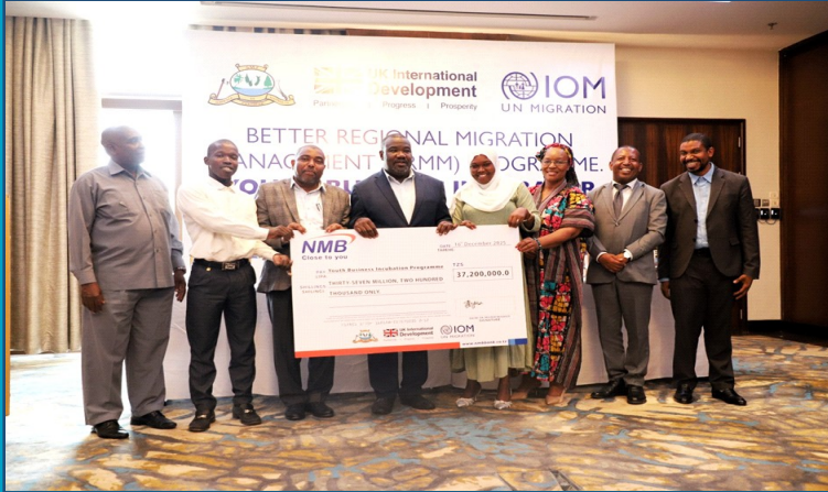
Mhe. Hassan Khamis Hafidh, Naibu Waziri wa Vijana, Ajira na Uwezeshaji akikabidhi hudi ya shilingi 37,200,000 Katika hafla ya uibuaji wa fursa za ujasiriamali kwa Vijana 10 (wanawake 8 na wanaume 2) katika shindano la matayarisho ya mpango wa biashara (business Plan)