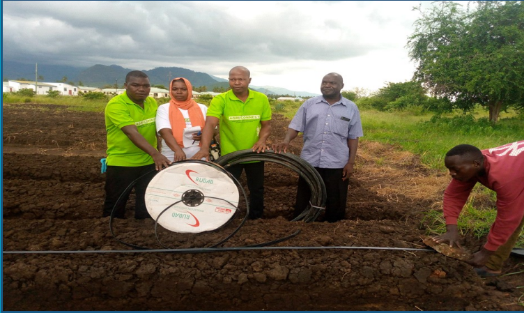
Ushirika wa Nia Safi wa Dunga Wilaya ya Kati Unguja ukiwa kwenye ziara ya kujifunza kilimo cha vitunguu Mkoa wa Morogoro.