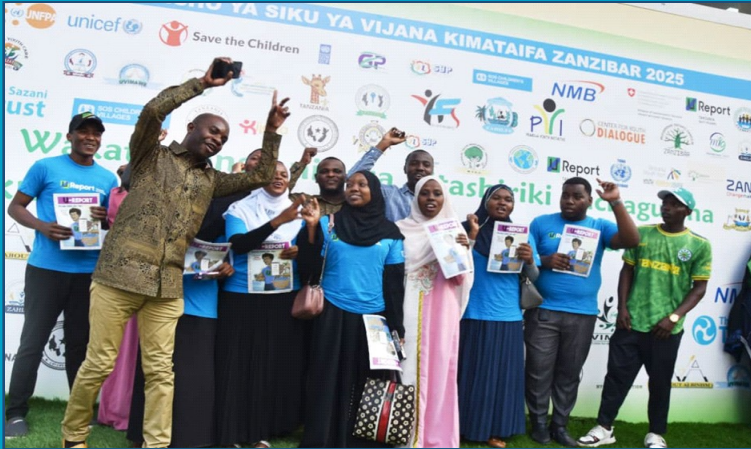
Vijana wakiwa wenye furaha katika maadhimisho ya siku ya Vijana kimataifa 2025