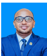
Ndg. Sultan S. Suleiman Mkurugenzi Mkuu Shirika la Nyumba